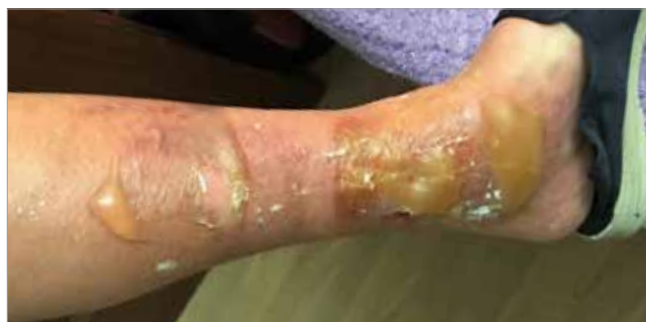
Figura 1. Giorno del trauma

La cute perilesionale è stata protetta mediante l'applicazione di una crema idratante e successivamente è stato applicato un bendaggio compressivo per assicurare il corretto posizionamento delle medicazioni sul sito di lesione. Si raccomandava il cambio di medicazione ogni 48h.