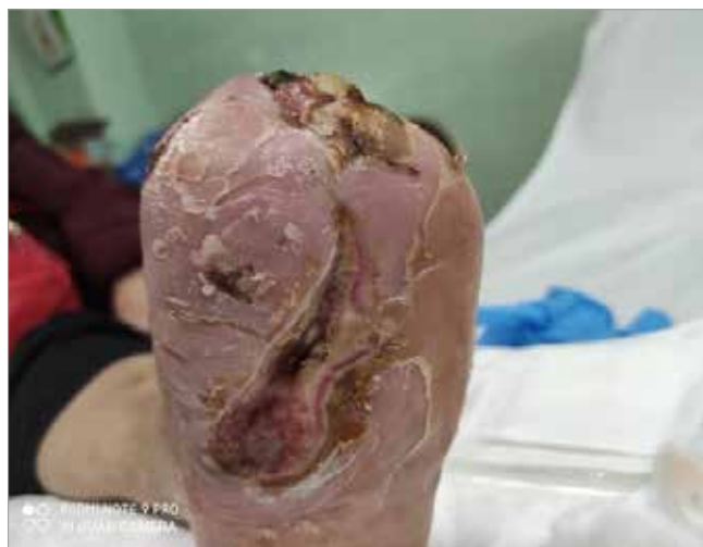
Figura 1. Valutazione iniziale da parte dello specialista di Wound Care prima dello sbrigliamento della lesione (Giorno 1)

l'essudato e proteggere il tessuto di granulazione e il tessuto epiteliale