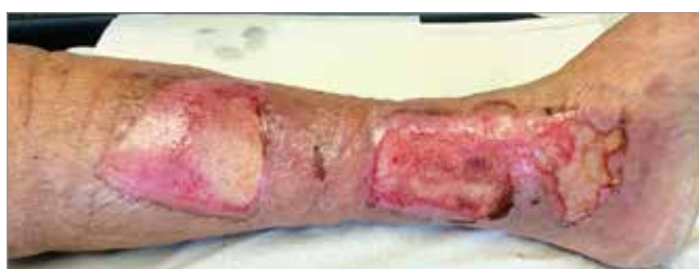
Figura 4. Giorno 10