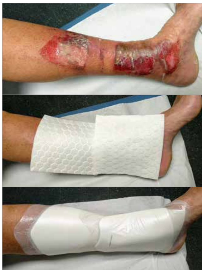
Figura 2. Giorno 1 - trattamento con Biatain Fiber applicata dopo aver effettuato pulizia e sbrigliamento

Per gestire il dolore, al trattamento locale è stato associato un trattamento via os con paracetamolo 650 mg ogni 6-8 ore. In caso di dolore severo durante le ore notturne, è stato prescritto tramadolo 50 mg.