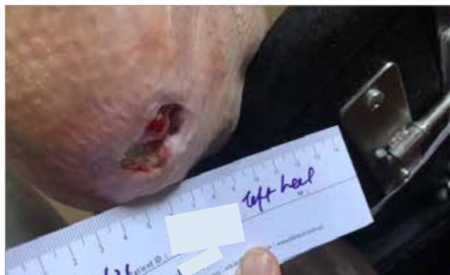
Figura 4. Giorno 43 (Dimensioni della lesione: 0,99cm 2 )

Il trattamento dell'ulcera da pressione su tallone non stadiabile si è efficientemente concluso dopo 5 mesi. Gli obiettivi principali della terapia sono stati lo sbrigliamento completo del tessuto devitalizzato e necrotico e la gestione dell'essudato in eccesso per favorire la creazione di un ambiente umido che agevolasse la guarigione della lesione. Alprep Pad è stato utilizzato per lo sbrigliamento meccanico e ha contribuito a supportare la preparazione ottimale del letto di lesione. Successivamente, l'utilizzo di Biatain Fiber come medicazione primaria ha favorito la gestione dell'essudato sieroso, riducendo la macerazione della cute perilesionale e supportando l'epitelizzazione del letto di lesione. Si conclude che Biatain Fiber ha dimostrato ottime caratteristiche tecnologiche microconformandosi al letto di lesione e rendendo il cambio di medicazione confortevole per il paziente, in quanto semplice ed atraumatico.