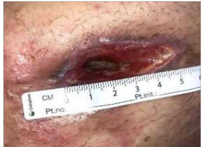
Figura 1. Giorno 1 - Valutazione iniziale da parte dello Specialista Wound Care

L'obiettivo chiave del trattamento era quello di rimuovere il tessuto non vitale e proteggere i tessuti di granulazione e di epitelizzazione: