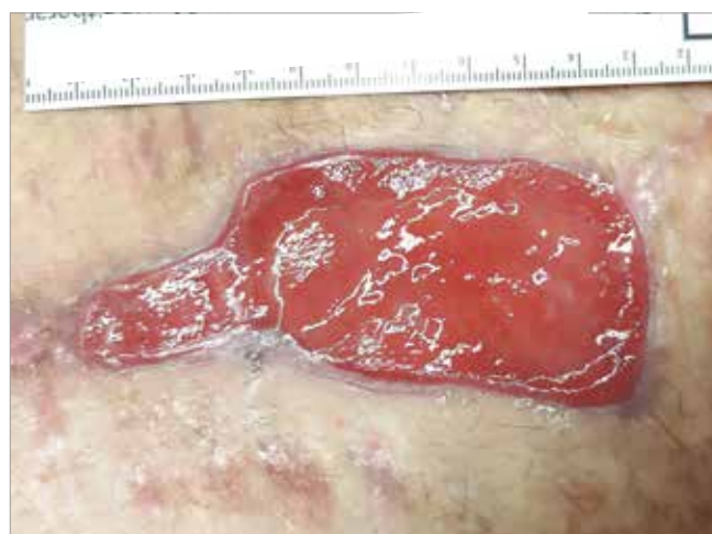
Figura 2. Giorno 1 - Inizio del trattamento con Biatain Fiber in associazione a Biatain Silicone

la gestione dell'essudato, invece, sono state utilizzate medicazioni polimeriche superassorbenti.