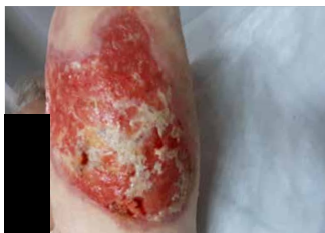
Figura 2. Inizio del trattamento con Biatain Fiber dopo sbrigliamento (Giorno 1)

3 settimane di trattamento ed è evidente notare come la quantità di essudato sia in questo caso, notevolmente ridotta.