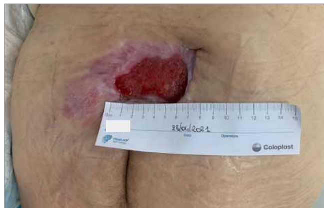
Figura 1. Giorno 1 - Valutazione iniziale della lesione (1 mese di utilizzo di Biatain Fiber)

Il trattamento prescritto è rimasto il medesimo per 8 settimane poiché la lesione si è progressivamente ridotta di dimensioni