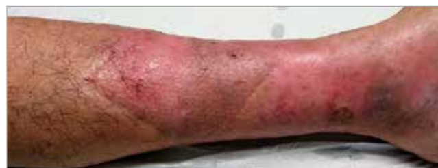
Figura 7. Giorno 71