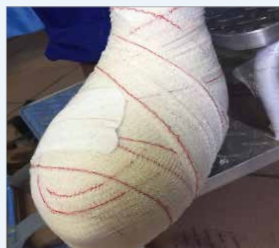
Un esempio di lesione che potrebbe essere trattata mediante questa tecnica è l'ulcera dell'avampiede.

Questa tecnica è molto utile al paziente perché fornisce il giusto supporto. Può altresì essere utilizzata in associazione ad un dispositivo di scarico pressorio tradizionale.