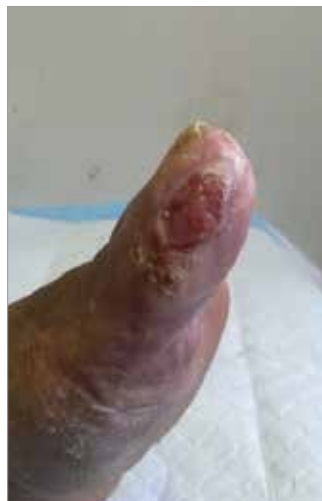
Figura 4. Giorno 82