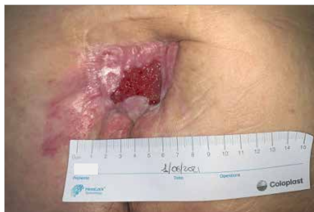
Figura 3. Giorno 33