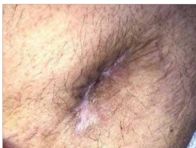
Figura 4. Giorno 30