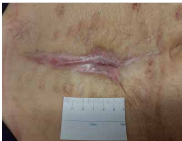
Figura 4. Giorno 65 - Guarigione completa della lesione

Biatain Fiber e Biatain Silicone hanno consentito di gestire efficacemente anche il cattivo odore legato alle elevate quantità di essudato presenti sul letto di lesione, ragione per cui le medicazioni potevano essere cambiate meno frequentemente, avendo un