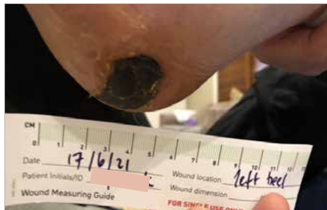
Figura 1. Valutazione iniziale della lesione

L'obiettivo del trattamento era quello di evitare il ricovero ospedaliero e prevenire la contaminazione microbica della lesione attraverso sbrigliamento, creazione di un ambiente umido e scarico pressorio dell'arto inferiore. Il primo intervento, quindi, ha previsto lo sbrigliamento del "tappo" di tessuto necrotico mediante l'utilizzo di una lama sterile. La profondità della lesione risultava ancora difficile da quantificare a causa dell'elevata quantità di tessuto necrotico presente. Conseguentemente, la lesione è stata sottoposta a sbrigliamento meccanico con Alprep® Pad (Coloplast). Il trattamento ha successivamente previsto l'utilizzo di un antimicrobico topico e l'applicazione di un film a livello della cute perilesionale; è stato successivamente applicato un idrogel per