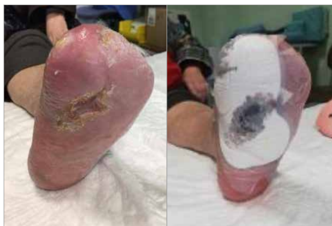
Figura 3. Giorno 42 (6 settimane)