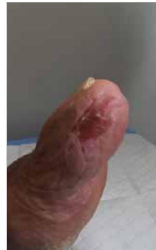
Figura 5. Giorno 124 (circa 4 mesi)

l'umidità della lesione ed è stata tenuta in posizione da Biatain Non-Adhesive 10 cm x 10 cm (Coloplast). Per favorire lo scarico pressorio dell'ulcera, è stata utilizzata una tecnica di medicazione definita "Football Technique" (Box 1; Rader e Barry, 2008). Visite di controllo e cambi di medicazione sono stati pianificati per due volte alla settimana. Alla paziente è stato prescritto un breve ciclo ad ampio spettro di amoxicillina e acido clavulanico 875 mg /125 mg due volte al giorno per 7 giorni.