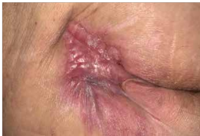
Figura 5. Giorno 92