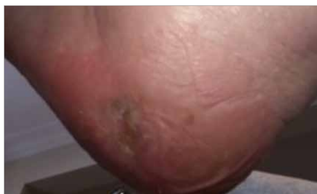
Figura 6. Circa 5 mesi