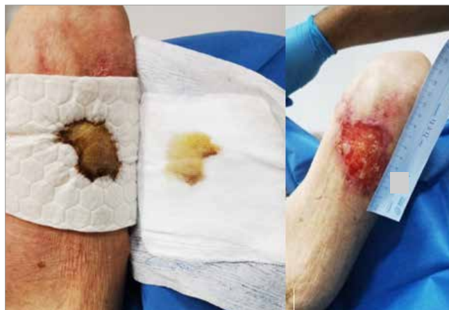
Figura 4. Giorno 22