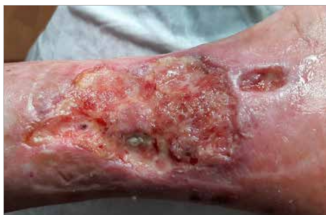
Figura 1. Valutazione iniziale da parte dello specialista Wound Care

I punteggi vanno da 0 a 100 e diversi autori in diverse pubblicazioni hanno proposto linee guida per l'interpretazione dei punteggi di Barthel. Shah et al (1989) suggerisce che i punteggi da 0-20 indicano la dipendenza "totale", 21-60 indicano la dipendenza "grave", 61-90 indicano la dipendenza "moderata" e 91-99 indicano una dipendenza "leggera".