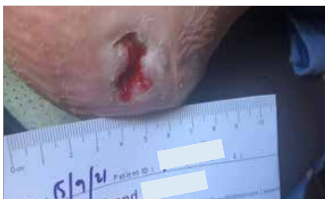
Figura 5. Giorno 70 (Dimensioni della lesione: 0.56cm 2 )