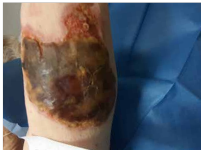
Figura 1. Valutazione iniziale da parte dello specialista Wound Care prima dello sbrigliamento

L'obiettivo chiave di gestione delle tre aree principali delle lesioni, il letto, il bordo di lesione e la cute perilesionale, era quello di gestire l'essudato per ridurre il rischio di macerazione. Come trattamento primario è stata applicata la medicazione avanzata Biatain Fiber associata al Biatain Silicone utilizzata come medicazione secondaria per proteggere la cute perilesionale. I cambi di medicazione sono stati effettuati con una cadenza bisettimanale per le successive 2 settimane a causa degli alti livelli di essudato. Trascorse due settimane, ( Figura 3 ), il cambio di medicazione è stato ridotto a una volta alla settimana. Figura 4 illustra la lesione dopo