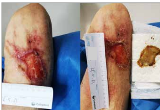
Figura 5. Giorno 29