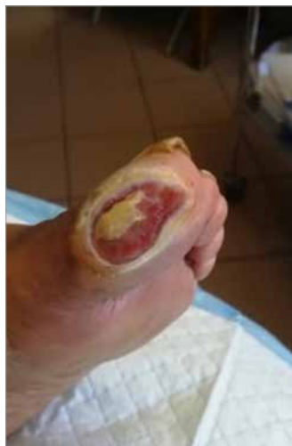
Figura 2. Giorno 30