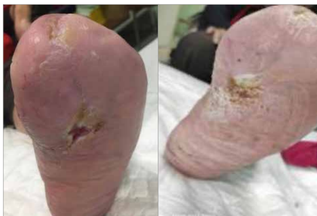
Figura 4. 3 mesi