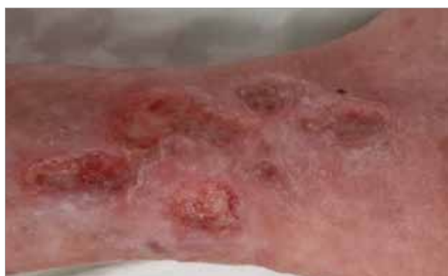
Figura 4. Meno di 4 mesi di trattamento