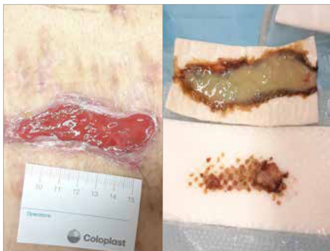
Figura 3. Giorno 34

Dopo 34 giorni di trattamento con Biatain Fiber e Biatain Silicone ( Figura 3 ), la lesione è stata rivalutata dallo specialista Wound Care. Si è evidenziata una progressiva riduzione della quantità di essudato e una riduzione di circa il 63% dell'area totale di lesione.