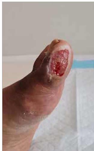
Figura 3. Giorno 54