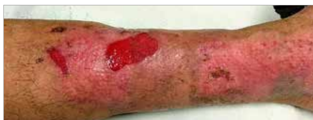
Figura 6. Giorno 43