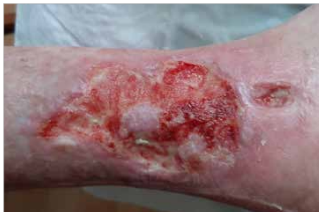
Figura 2. 2 settimane di trattamento