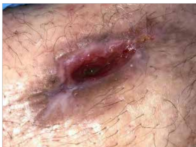
Figura 3. Giorno 15