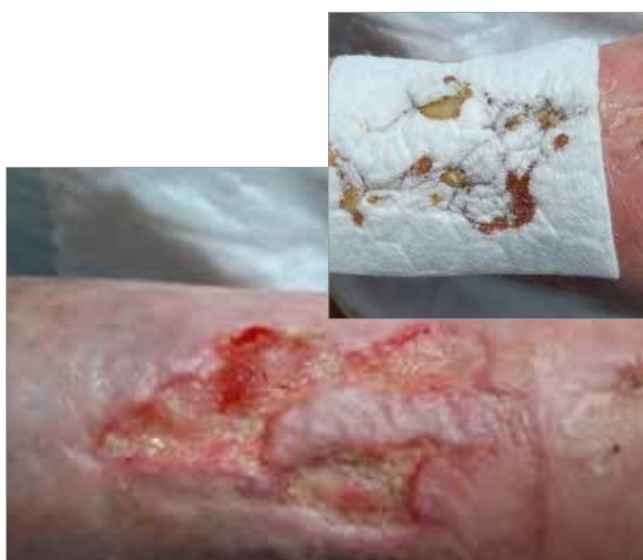
Figura 3. 2 mesi di trattamento