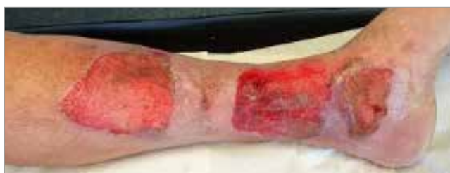
Figura 3. Giorno 3

Dowsett C, Swanson T, Karlsmark T (2019) A focus on the Triangle of Wound Assessment. Wounds International 10(3): 34-9