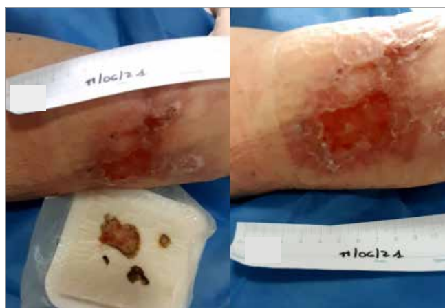
Figura 6. Giorno 43

l'interruzione dell'applicazione di Biatain Fiber. Una settimana dopo (Giorno 36), la cute perilesionale risultava macerata, e si era formato tessuto iper-granulato sul letto della lesione. Conseguentemente si è ripreso il trattamento con Biatain Fiber come medicazione primaria e Biatain Silicone come medicazione secondaria. Dopo 1 settimana (Giorno 43; Figura 6 ), la condizione del letto di lesione era notevolmente migliorata e la cute perilesionale risultava meno infiammata.