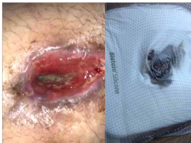
Figura 2. Giorno 3

Liang MK, Li LT, Avellaneda A et al (2013) Outcomes and predictors of incisional surgical site infection in stoma reversal. JAMA Surg 148: 183-9