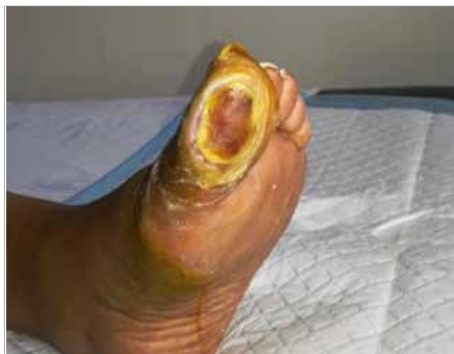
Figura 1. Primo giorno di trattamento con Biatain Fiber

La ferita è stata sottoposta a sbrigliamento con un gel enzimatico, ma l'umidità della lesione è aumentata. Pertanto, era importante scegliere una medicazione che riducesse al minimo il rischio di macerazione della cute perilesionale. Biatain Fiber 10 cm x 10 cm è stata utilizzata come medicazione primaria per gestire