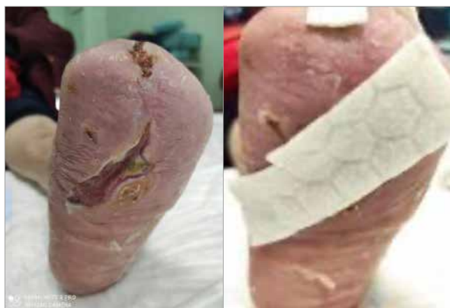
Figura 2. Giorno 26

Dowsett C, Swanson T, Karlsmark T (2019) A focus on the Triangle of Wound Assessment. Wounds International 10(3): 34-9