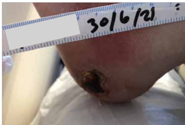
Figura 2. 2 settimane di trattamento (Dimensioni della lesione: 4,53cm 3 )