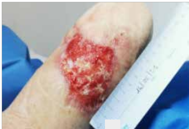
Figura 3. Giorno 15