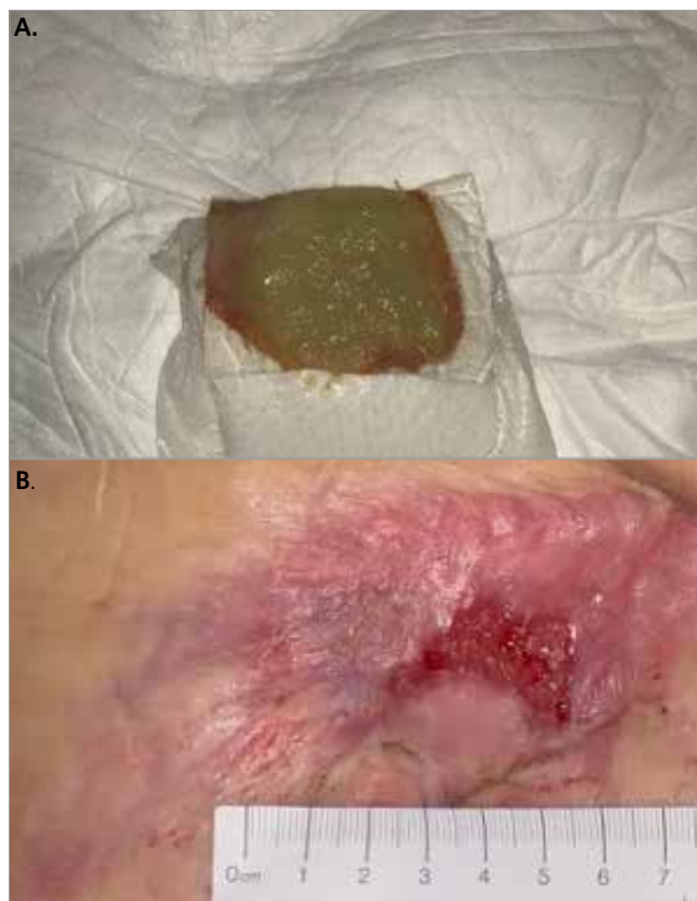
Figura 4. Giorno 48

Dowsett C, Swanson T, Karlsmark T (2019) A focus on the Triangle of Wound Assessment. Wounds International 10(3): 34-9