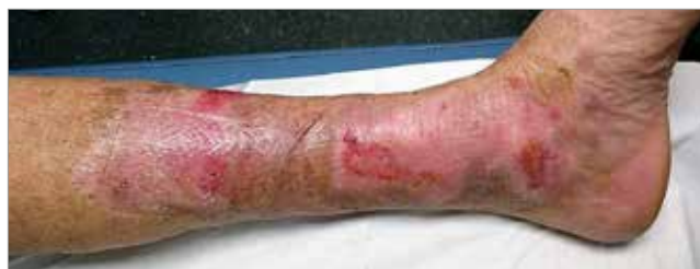
Figura 5. Giorno 28